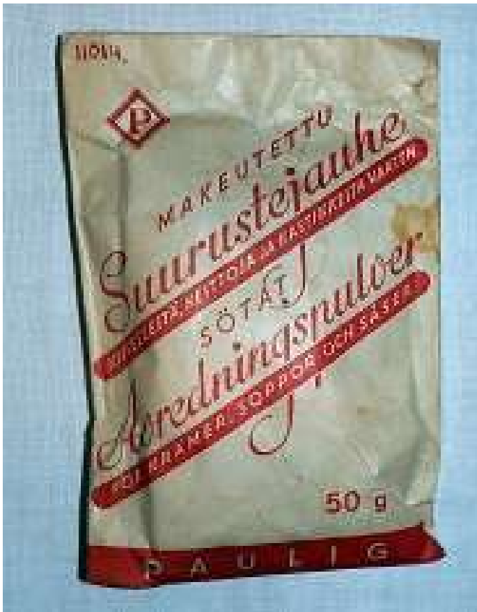
Liite 8: Munanvalkuaisen korvaava tuote